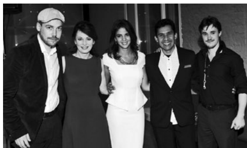
Fatma Said (Start Up Preisträgerin 2013), Iris Berben & Trio Laccasax